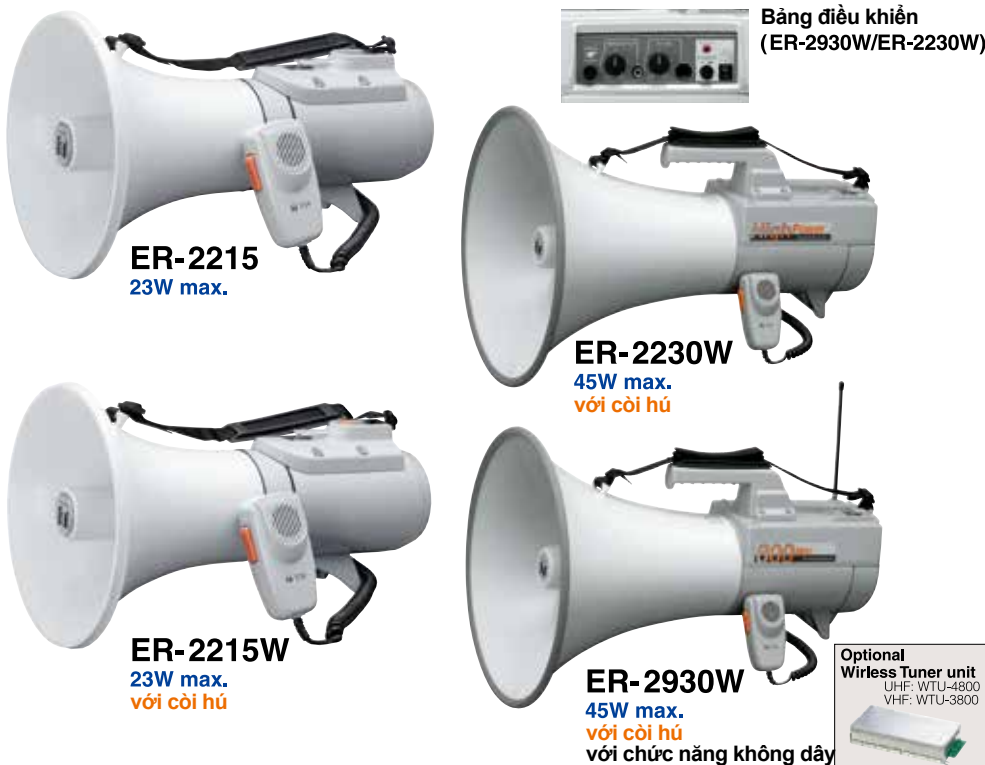
ER-2215 23W max.