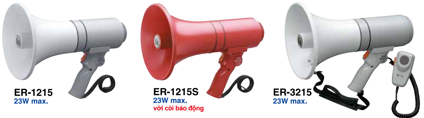
ER-1215 23W max.