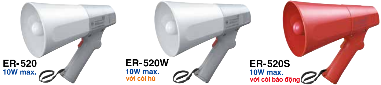
ER-520 10W max.