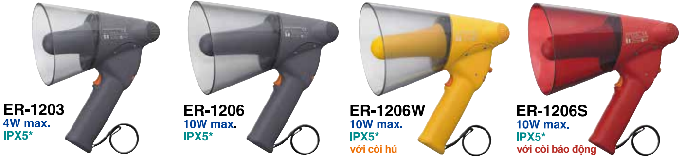
ER-1203 4W max. IPX5*