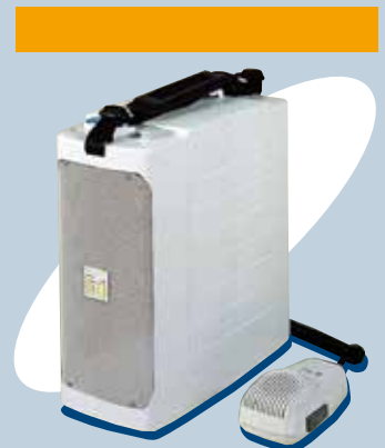
ER-604W (10W max.)

ER-604W là loại megaphone đeo vai hoặc để bàn với rất nhiều chức năng tiện dụng như còi hú, có thể điều chỉnh âm lượng micro và có phím nhấn để nói. Megaphone có thể được sử dụng cùng với micro điện động, micro điện dung cũng như hỗ trợ ngõ vào AUX để phát các nguồn khác từ thiết bị ngoại vi. Megaphone ER-604W có thể sử dụng nguồn ắc-quy hoặc nguồn ngoài.